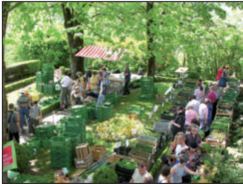
Gut besuchter Setzlingmarkt in Wildegg

Tel.: 062 887 08 30 E-Mail: schloss.wildegg@slm.admin.ch Website: www.musee-suisse.com